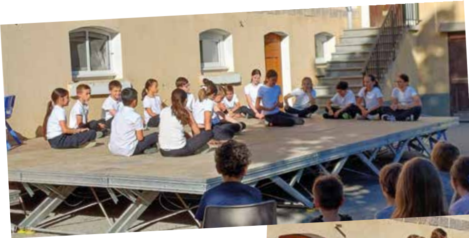
SPECTACLE DES CM1 ET CM2