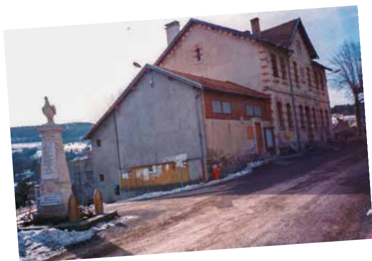
LA MAIRIE AVANT L'ÉCOLE